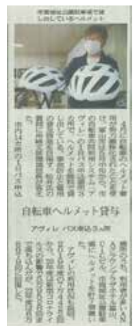
令和 5 年 6 月 13 日 北日本新聞