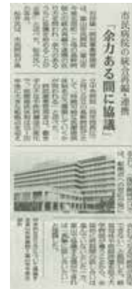
令和 4 年 12 月 8 日 北日本新聞