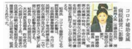
令和 5 年 6 月 13 日 富山新聞

皆さまの不便を解消し、安心・安全な生活のための提案をしていきます。これからもご支援よろしくお願ひいたします。